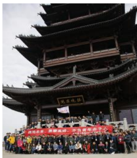
在辞旧迎新之际,为丰富企业文化,营造迎新氛围,切实维护职工身心健康,增强职工归属感和幸福感,倡导职工养成健康的生活方式。12月23日,杭州建工集团工会、团委联合举行“拥

抱未来、勇攀高峰、不负青年赤子心”大型迎新登山活动,此次活动也是集团第四届团委成立以来的第一次大型集体活动。从虎山公园出发,登顶望宸阁后直下山,途经翠峰阁,最后在半山国家森林公园门口结束,全程7.43公里。