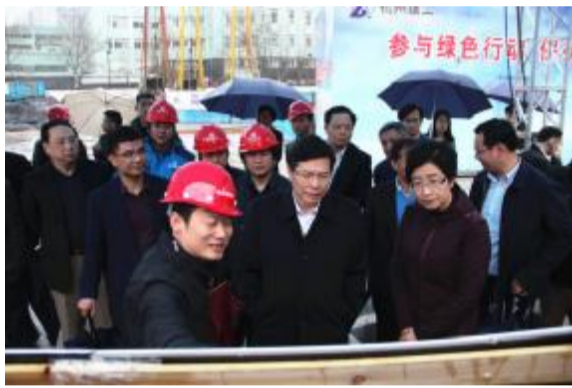
▲一排左二:杭州市市长徐立毅;二排左四:杭州建工集团总经理宋志刚

3月13日,杭州市市长徐立毅及上城区政府、区住房与城建局、湖滨指挥部等一行领导在杭州建工集团宋志刚总经理等人员的陪同下,莅临集团承接的杭政储出[2015]51号地块商业、商务兼容交通设施项目进行现场视察。