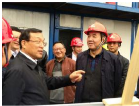
▲2016年11月17日,时任张鸿铭杭州市市长(一排左一)前来杭州建工集团工联二期项目现场视察,集团总经理顾闻楼新安进行陪同(一排右一)

建设最新进展后,徐立毅市长强调,“该项目地理位置特殊,在开展施工时,务必要做好与周边单位、居民的沟通协调工作,尽量减少对周边环境的影响。项目建设过程中,在抓工程进度的同时,一定要以工程安全和质量为前提。”