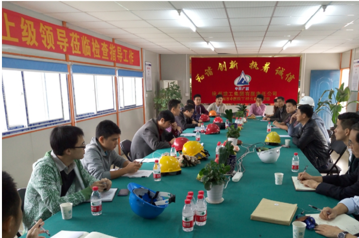
现场文明施工和标准化工地建设工作提出了指导性建议。随后检查组来到项目部会议室对安全内

检查组一行首先深入施工现场,对施工现场的五台起重机械、文明施工和标准化工地建设工作进行了全面检查。在检查过程中,检查组对杭州市中医院丁桥分院项目部自开工以来,项目班子齐抓共管安全质量管理工作的做法给予了充分肯定,并对今后如何进一步搞好施工