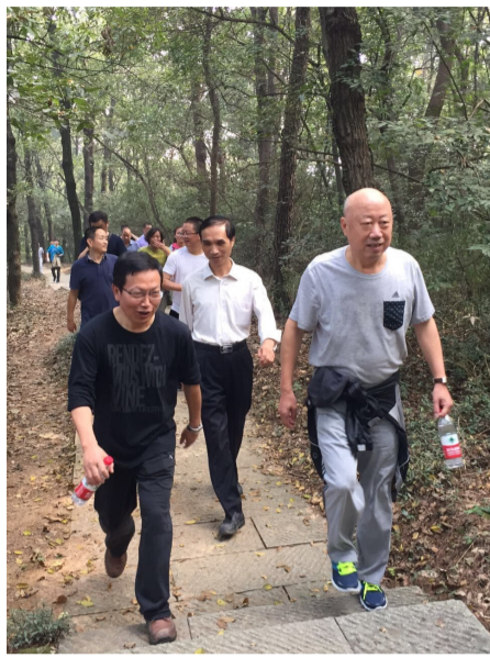
大家纷纷表示要坚持健走，相互督促，以更好的精神风貌绿色出行、快乐工作、健康生活。 (杭构集团 高燕)