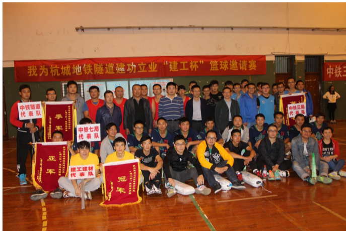
为运动员们加油打气。

金秋十月，丹桂飘香。为丰富员工业余文化生活，促进企业文化交流，本着“锻炼身体，促进友谊”的宗旨，由杭构·建工建材公司主办，中铁三局地铁SG2-23标项目经理部、中铁七局地铁SG2-22标项目经理部、中铁隧道环城北路地下通道项目经理部协办的“我为杭城地铁隧道建功立业‘建工杯’篮球邀请赛”顺利举行。