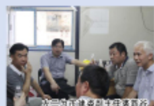
市建委副主委赴杭安公司调研。

7月30日,市建委副主委、代市长张鸿铭一行来到中北花园项目工地,对一线员工进行慰问。