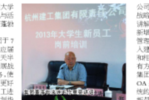
杭州建工集团有限责任公司 2013年大学生新员工岗前培训

来董事长谆谆教导大家,每个人都有梦想,我们的梦想、我们的信念会潜移默化地引导我们走向成功。而我们的梦想,将从这里起航。来董事长给大家提出了“要行动,要创新,要坚持,要学习,要感恩”的期望。他以“和尚云游”的故事生动地阐述了“任何事不能等