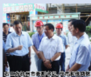
市建委副主委、代市长张鸿铭视察近江单元安置房工地。

7月17日下午,杭州市代市长张鸿铭在上城区区委书记廖承潮、上城区安居建设管理中心主任高燕东的陪同下,视察了由集团承建的近江单元拆迁安置房工程,并深入现场,详细了解了工程的建设情况和工人的生活情况。