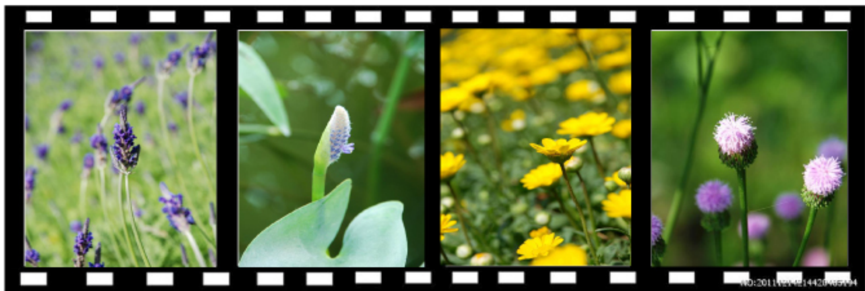
花朝节掠影

有这么个人催着你写点东西，别老是只知活吞硬咽往嘴里塞而不及时的消化整理，那还是挺好的。眼瞅着豆瓣上“读过”和“笔记”后面跟的数字一天天地累积起来时的那种愉悦感却伴随着看到书评记录始终寥寥的困惑，内心早已将自己鄙视不知多少遍，但鄙视归鄙视，始终放不下这一摊子。没有养成多动脑多思考多输出的好习惯，顶多就是附注再多写些字。是以，正一边自我批评一边整理思绪做输出。